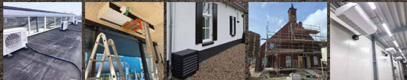
renovatie - airco's - warmtepompen - vloerverwarming retail - cafetaria - kerken - kantoren - (luce) particuliere woningen