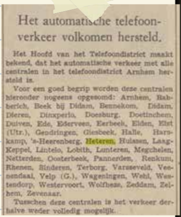
(Arnhemse Courant, 27 mei 1940)