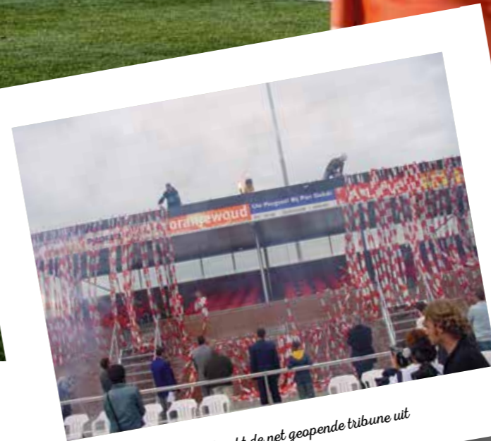
De jeugd pakt de net geopende tribune uit