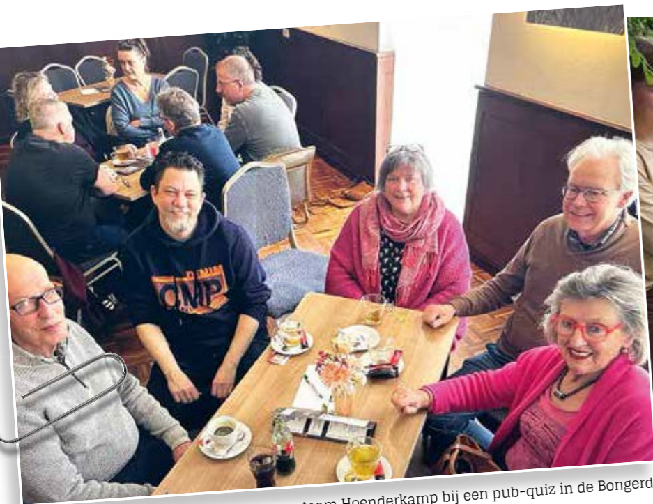
Een deel van team Hoenderkamp bij een pub-quiz in de Bongerd

DOOR LIESKE MEIMA | Een van de hofjes van de Zesmorgen in Heteren is altijd al een actief buurtje geweest. Nieuwe bewoners worden er steevast met een bloemetje verwelkomd en dat gebaar zet meteen de toon! Men houdt elkaar op een prettige, ongedwongen manier in de gaten en weet elkaar te vinden voor hulp, hetzij rechtstreeks hetzij via de app-groep.