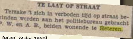
(PGNC 23 dec 1940)