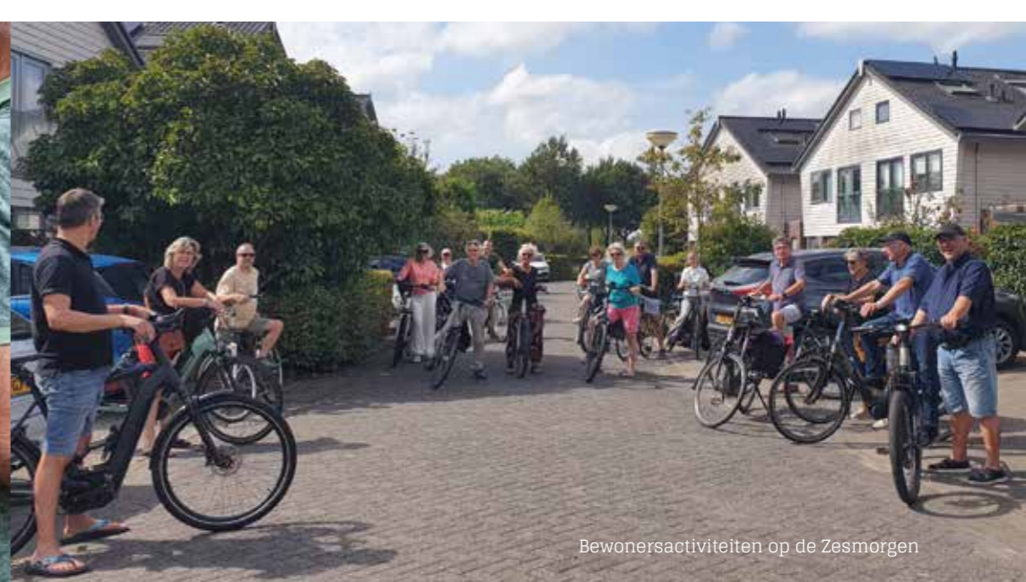
Bewonersactiviteiten op de Zesmorgen