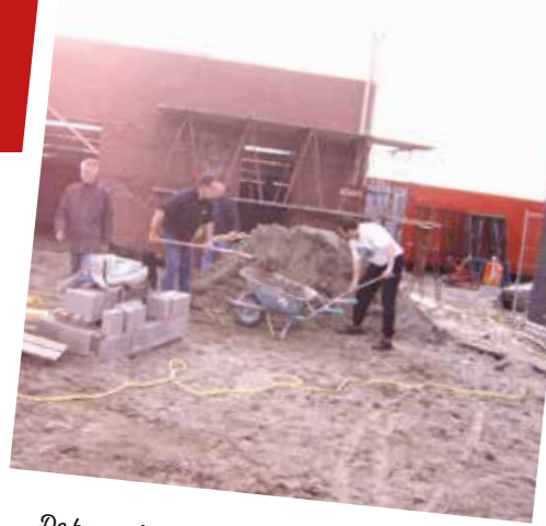
De bouwploeg werkt aan de bouw van de tribune