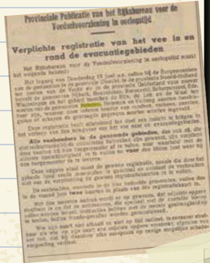
(Provinciale Geldersche en Nijmeegsche Courant, 15 juni 1940)