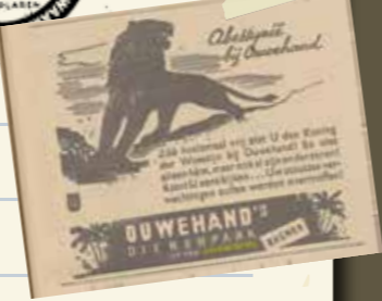
Advertentie Ouweland, 10 mei 1940 (Dagblad De Grondwet)