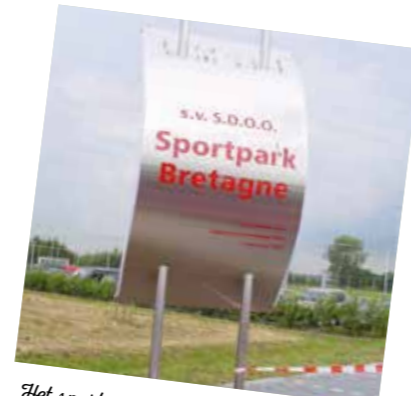
Het sportpark heeft een naam Bretagne